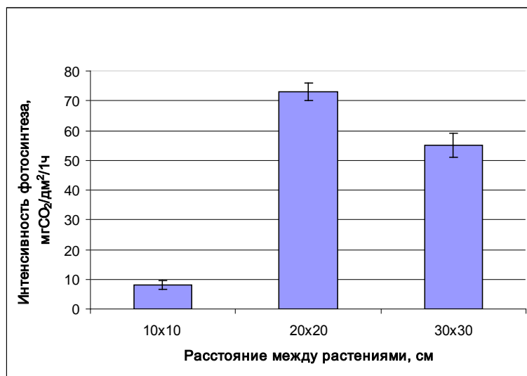
Рисунок 8 – Интенсивность фотосинтеза листьев фасоли с различной площадью посева