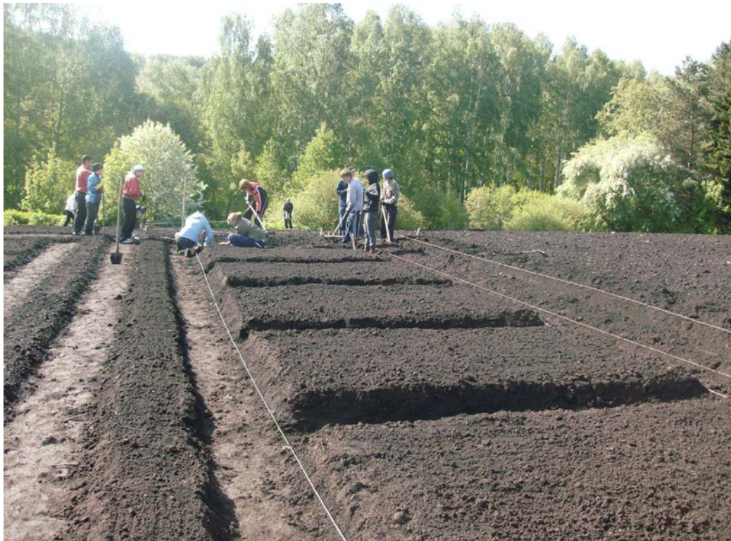
Рисунок 1 – Закладка опыта с площадью делянок равной 6 м 2 (___.__.20.__ г.)